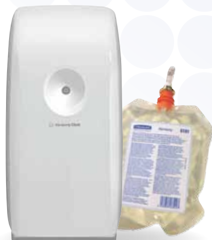
Sponder für Lüfterfrischungssystem 6994