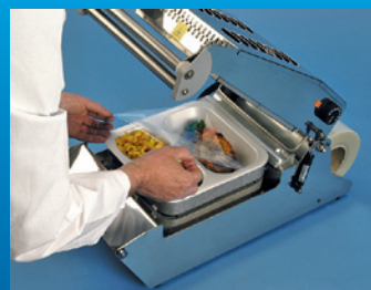
Folie über die Schale ziehen