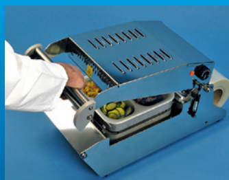
Griff mit kurzem Druck schließen