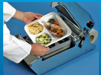
Versiegelte Schale entnehmen

Die Siegeltemperatur ist am Gerät stufenlos einstellbar. Kurzer, kräftiger Andruck von Hand versiegelt sicher und zuverlässig, während die Folie automatisch von der Rolle getrennt wird.