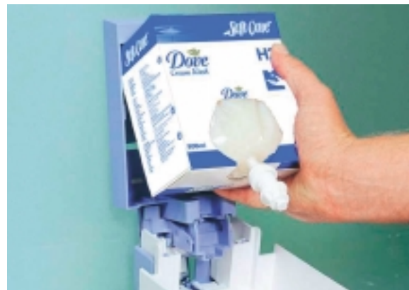
Die hygienischen Kartuschen können im Handumdrehen ausgetauscht werden

Soft Care Line Produkte befinden sich in hygienisch einwandfrei versiegelten Beuteln mit integrierter Dosierpumpe, die nach Gebrauch zusammen mit der Kartusche ausgetauscht wird. Verkeimtes Produkt oder eingetrocknete Seifenrückstände gehören der Vergangenheit an, da der komplette Mechanismus nach 800 Dosierungen entsorgt wird.